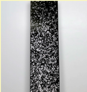
Recurrent Mallarmé, 2018 Disco duro, ordenador. video

Esta obra está inspirada por Bioy Casares, quien insistió en que la ausencia y presencia no son opuestos sino complementarios. Y quien planteó la posibilidad de creación de una máquina que reprodujese la realidad frente a los sentidos humanos, y Rafael Lozano Hemmer ha explorado poco a poco la tecnología para crear la obra de arte que más se acerque a tal ambición.