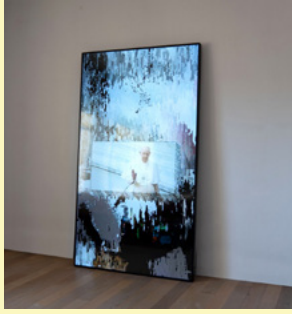
Daniel Canogar Madrid (1964)

Al inicio de su trayectoria se inclinó por la fotografía como medio principal, pero luego comenzó a explorar fronteras de la imagen, incorporando la imagen proyectada, la fibra óptica y las instalaciones interactivas. En su obra explora la liquidez de la información en la actualidad, y las implicaciones políticas a gran escala del consumo y generación desmedida de datos en la red. Ha explorado el uso de tecnologías obsoletas y algoritmos para la creación, su trabajo genera una relación entre expresionismo abstracto y arte tecnológico.