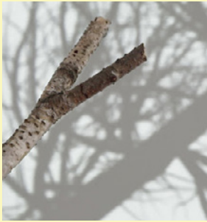
Bifurcación, sombra de obra 2, 2012 Computador, kinect, proyector, metal, motor

Lozano crea plataformas para la participación del público, utilizando tecnologías como luces robóticas, fuentes digitales, vigilancia computarizada, muros multimedia y redes telemáticas para involucrar el cuerpo y los sentidos, consiguiendo una construcción entre ambas partes, el artista y el espectador, para lograr el ejercicio de interpretación de la obra. Esta interacción hace que su trabajo tenga un carácter efímero, es decir que la obra muere con la ausencia del espectador y reaparece en el espacio cuando llega un nuevo cuerpo que le activa.