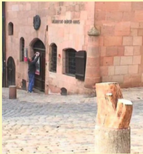
Miler Lagos Colombia (1973)

Esta pieza documenta el cambio urbanístico de la ciudad de Charlotte, North Carolina. Los edificios se elevan, caen y se desintegran; los entornos urbanos se densifican o estilizan; los paisajes cambian lentamente. Carter construyó réplicas en papel de redes viales, edificios emblemáticos y transformaciones de jardines, para realizar un ejercicio de montaje análogo y animación en el que se presenta el paso del tiempo en una de las ciudades con desarrollo más acelerado de Estados Unidos. En la pieza incluye predicciones futuristas de cómo imagina la ciudad, el cambio de materiales y de estilos arquitectónicos.