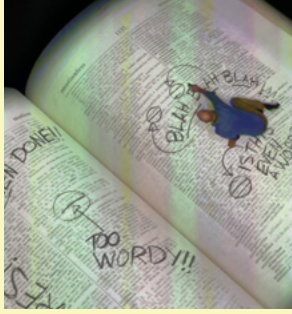
Peter Sarkisian Estados Unidos, 1965

Es uno de los primeros videoartista en usar mapping digital. En 2005, fue nombrado Maestro Videoartista por el Fondo Nacional de las Artes (NEA - USA). Los primeros métodos de Sarkisian se utilizan ahora en las industrias del entretenimiento y multimedia.