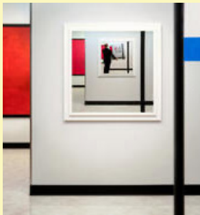
Gregory Scott Estados Unidos (1957)

Maelstrom, está en constante mutación y permanece inacabada siempre: la noticia del momento cubre la noticia anterior. Se genera una superposición de contenidos e imágenes que nos permiten reflexionar sobre la fugacidad de los ciclos de noticias y de la vida misma.