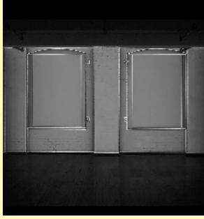
Pablo Valbuena España (1978)

Actualmente trabaja desde el sur de Francia. Pablo Valbuena investiga sobre el espacio, el tiempo, la percepción y el uso de la luz y el sonido como materia.